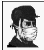
Ватно-марлевая повязка (ВМП)